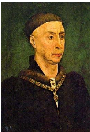
Hertog Filips de Goede (1396-1467)